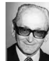
Don Osvaldo Pugliese, mi tango estirado

Figures et mouvements adaptés au tempo rythmé de Carlos Di Sarli