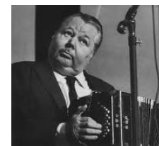
Troilo, el gran Desconocido

Moments de pause et mouvements sur la mélodie