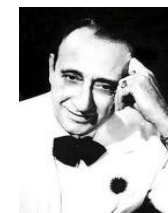
El maestro del compas, Juan Darienzo

Matices musicales tanguissantes ou intenses