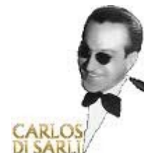
El Tuerto, Di Sarli, el sentimiento milongero

Par ailleurs, un cours spécial débutants sera donné le dimanche 6 novembre